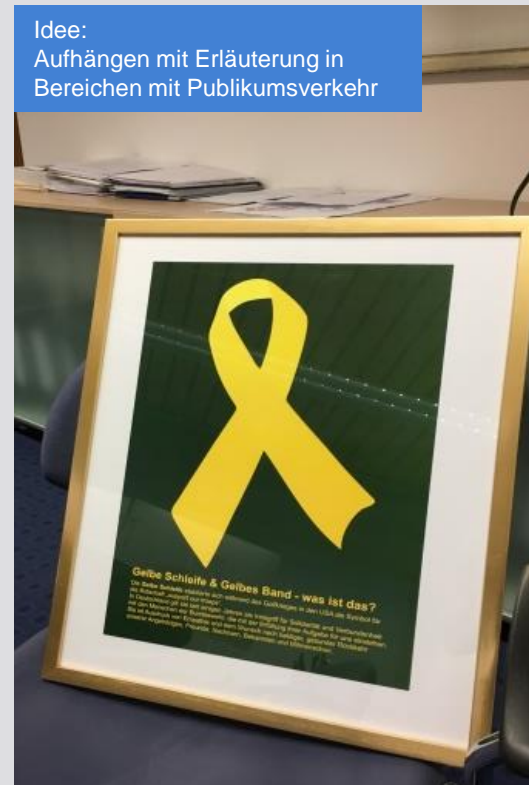
Idee: Aufhängen mit Erläuterung in Bereichen mit Publikumsverkehr

Landkreis Cham und WJ Cham wollen das Symbol „Gelbe Schleife“ in der breiten Öffentlichkeit vorstellen und in allen Gemeinden verbreiten.