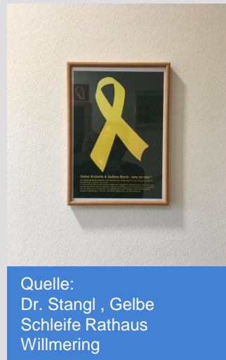
Gelbe Schleife Rathaus Willmering

Stadt Furth im Wald Markt Lam Stadt Cham Gemeinde Walderbach Gemeinde Wald Gemeinde Grafenwiesen Gemeinde Rettenbach Gemeinde Schönthal Gemeinde Pemfling Gemeinde Arrach Stadt Waldmünchen Gemeinde Blaibach Gemeinde Willmering Gemeinde Schorndorf Gemeinde Waffenbrunn Stadt Roding / Versorgungsbataillon Stadt Rötz