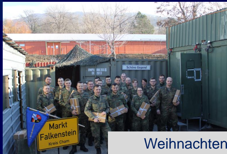
Weihnachten 2017 im Kosovo