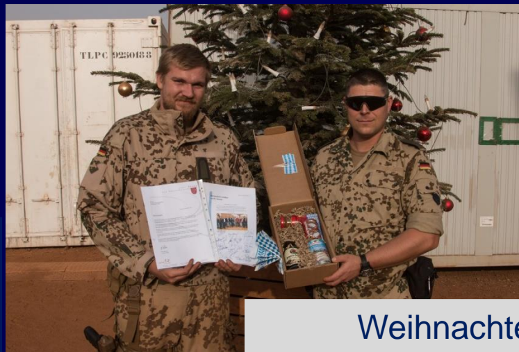
Weihnachten 2017 in Mali

Weihnachtsgrüße an die Soldatinnen und Soldaten im Ausland Die „Empfänger“ im Einsatz